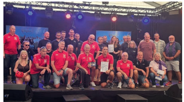
▲ Gewinner beim Stadtradeln Nidda mit über 18.000 gefahrenen Kilometern. Platz 2: FFW Nidda, über 8.000 km. Platz 3: Kirche unterwegs, über 6.000 km