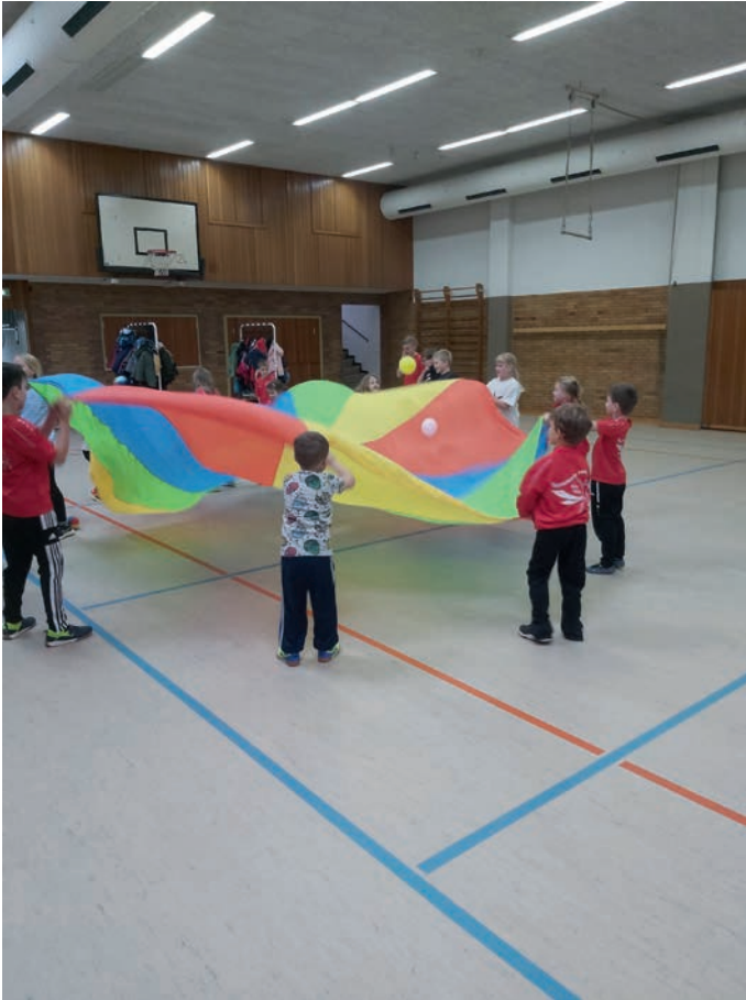
▲ Die Bilder zeigen psychomotorische Angebote in unseren Turnstunden: Kinder bewegen gemeinsam ein buntes Schwungtuch und erleben dabei Bewegung, Rhythmus und soziales Miteinander.