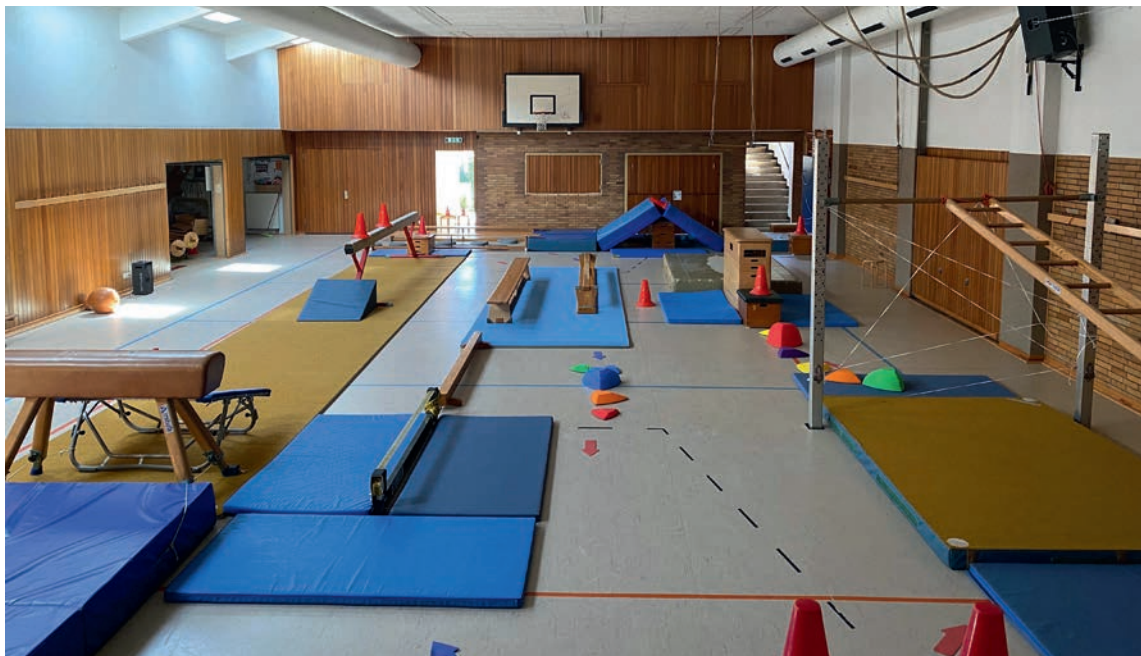
Dieser Hindernisparcours wurde mutig von den Ferienspiel-Teilnehmern bezwungen