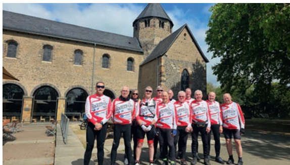
▲ Die 92 km gefahrene Karfreitagstour am Karsamstag wegen schlechtem Wetter. Mit 12 Personen ging es in Richtung Gießen.