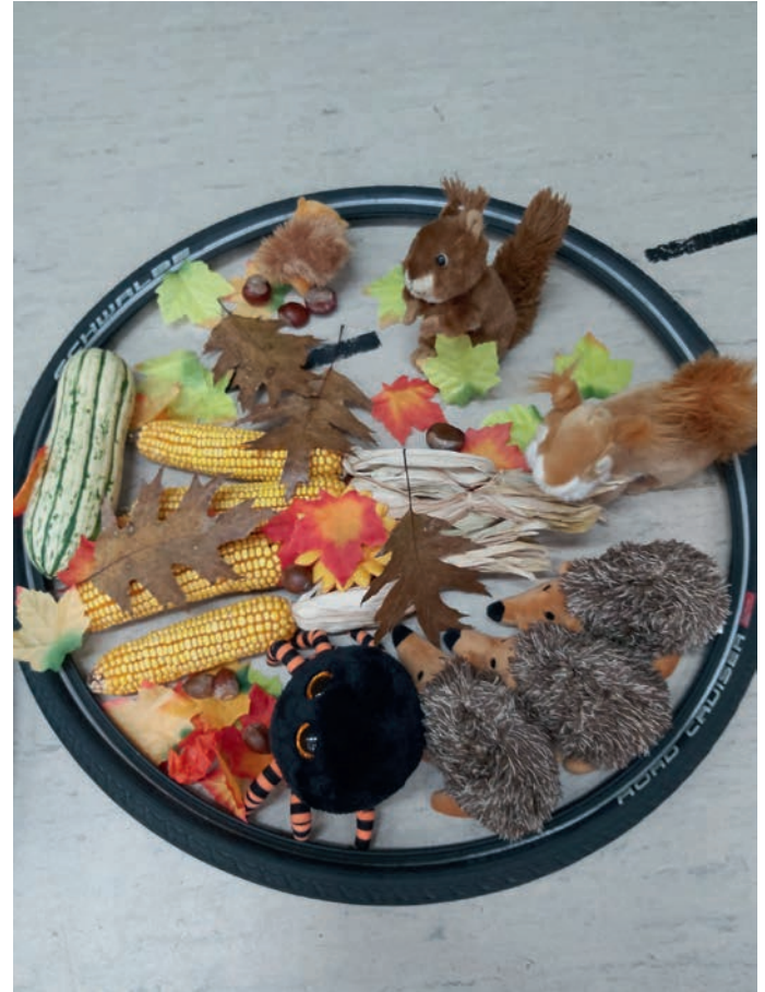
▲ Eine herbstliche Materiallandschaft mit Natur- und Spielmaterialien, die zum Fühlen, Entdecken und fantasievollem Spiel einlädt. Beide Situationen fördern Wahrnehmung, Bewegung, Kreativität und gemeinsames Erleben – zentrale Elemente der Psychomotorik.