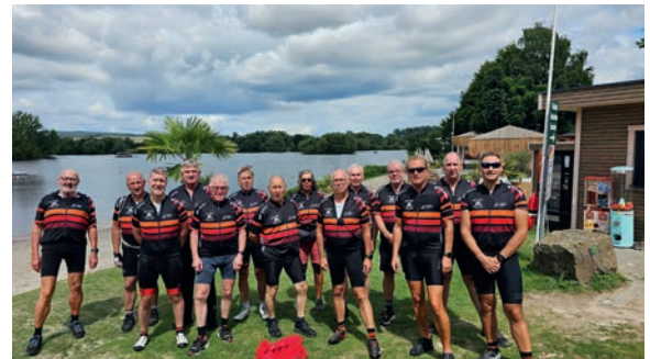
▲ Tour zum Dudenhofener See – 107 km und 14 Biker