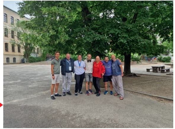
Ausflüge gehörten auch zum Programm ▶